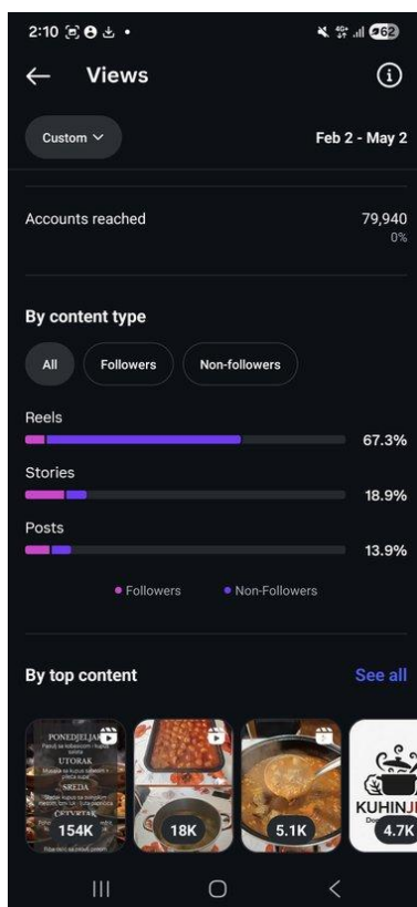
Doseg i raspodela sadržaja