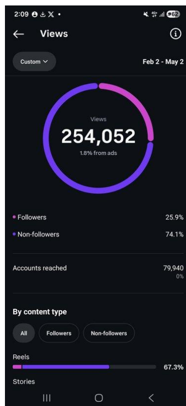
Aktivnost profila i top videi

Napomena: 1,8% pregleda dolazi od oglasa — preostalih 98,2% je čisto organsko, bez plaćanja.